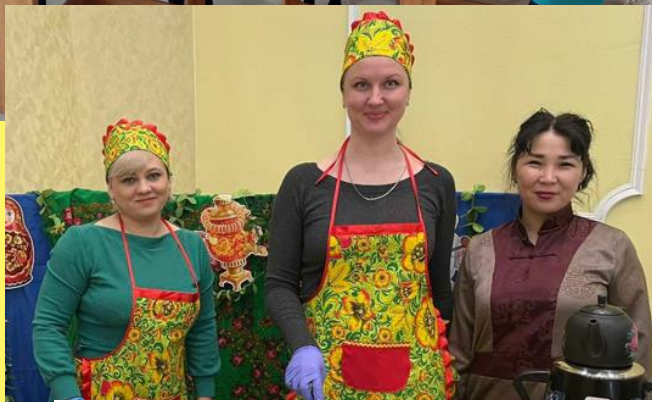
Педагогическая ярмарка 2022