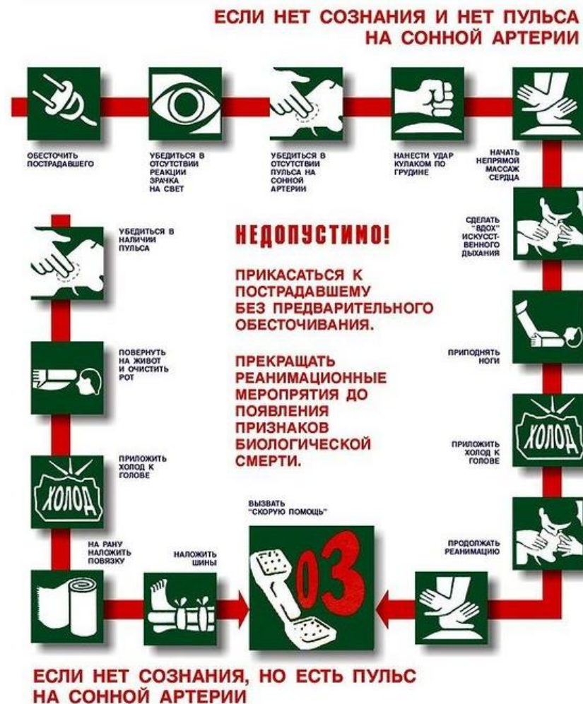
СХЕМА ДЕЙСТВИЙ В СЛУЧАЕ ПОРАЖЕНИЯ ЭЛЕКТРИЧЕСКИМ ТОКОМ